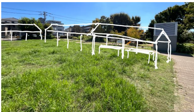
※テント等のイメージ図